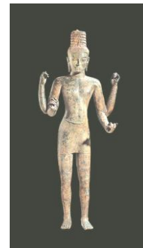
Thai 6 th C.

Kimbell Art Museum Pakistan, Gandhara region 1st-2nd century A.D., Kushan period www.pbs.org/wgbh/sisterwendy/works/bod.html จักรวรรดิคุษาณะ ค.ศ. 100-300